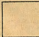
Åkerareal 1910 586,000 hektar