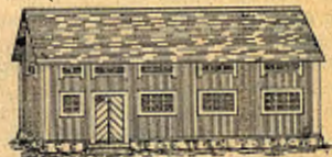
Lokalföreningar 1917 1,280